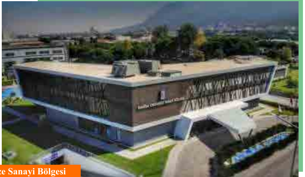
Manisa Organize Sanayi Bölgesi