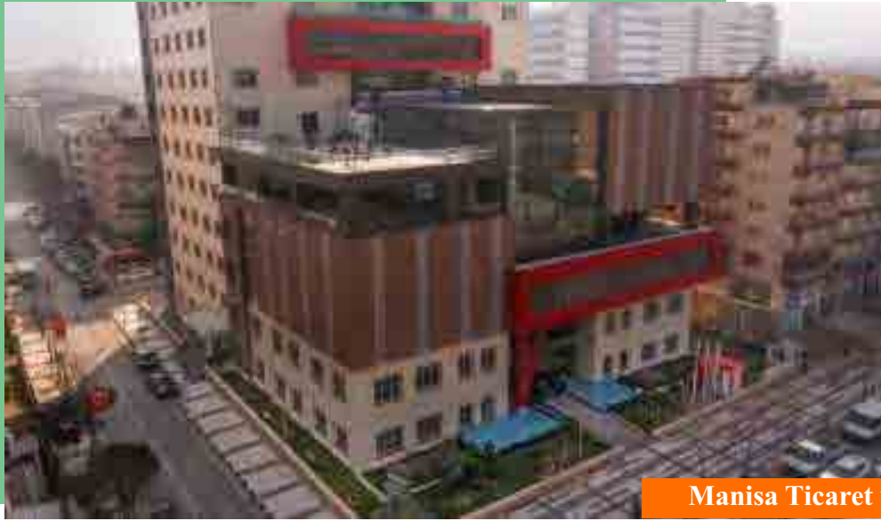
Manisa Ticaret ve Sanayi Odası